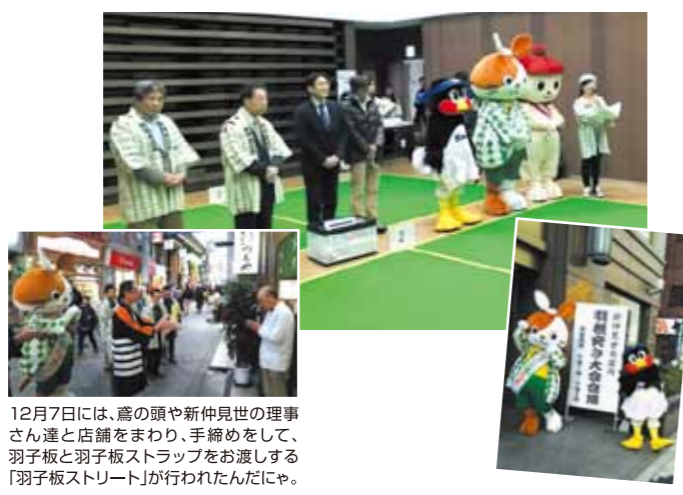
12月7日には、鷹の頭や新仲見世の理事さん達と店舗をまわり、手締めをして、羽子板と羽子板ストラップをお渡しする「羽子板ストリート」が行われたんだにや。