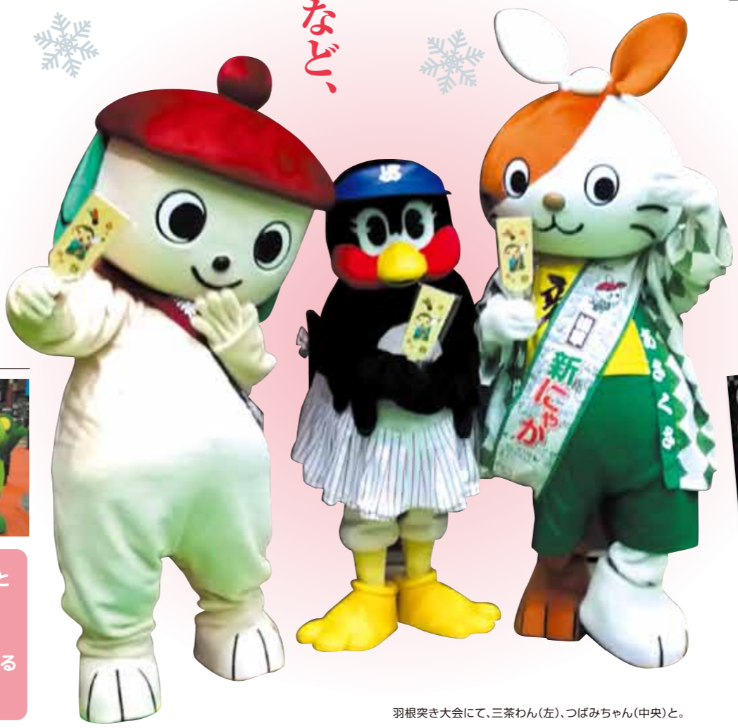
羽根突き大会にて、三茶わん(左)、つばみちゃん(中央)と。

新にやオリジナルTシャツとエゴ怪獣コラボ缶バッジが好評発売中のにや〜。三ッ福・ハンモトさんで売ってるから、みんな買ってにや〜